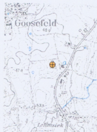
Abb. 2: Ausschnitt des Vorranggebietes PR2_RDE_025: Falsche Bestands-WKA